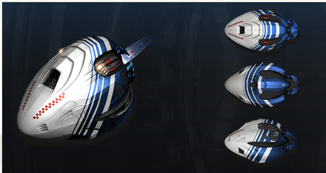
➤ EVE联动中国航天：彰显科技强国