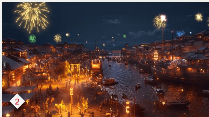
➤ 2. 率土之滨：再现三国文韬武略