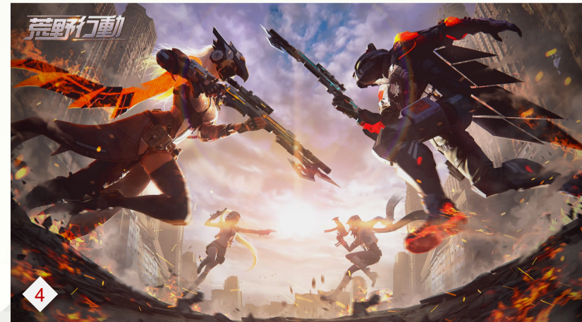
4. 荒野行动：特种作战强势出海