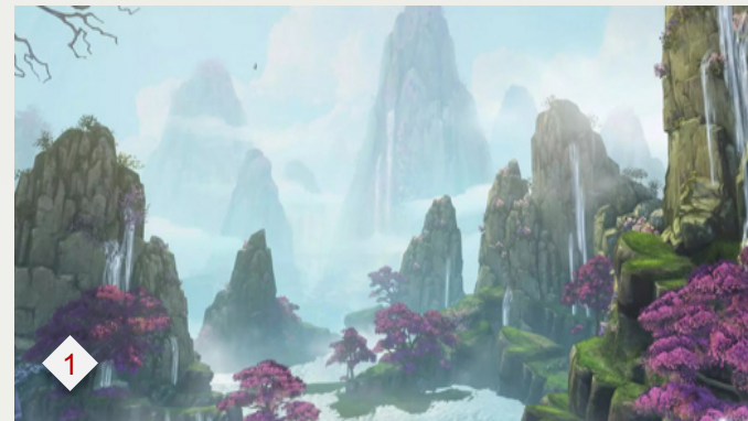
➤ 1. 天下3：山海经国风大作