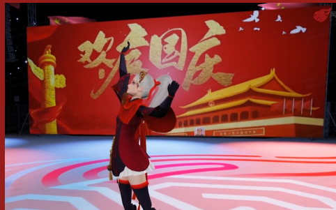
音乐自动生成舞蹈