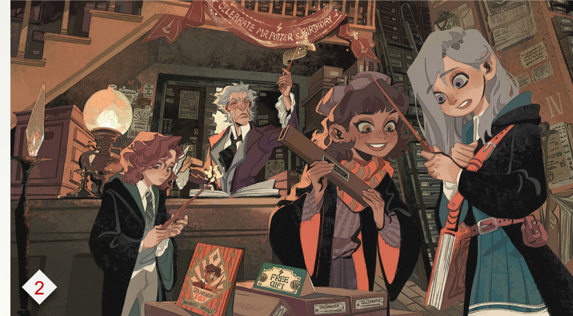
2. 哈利波特魔法觉醒：经典IP大制作