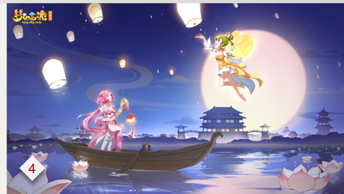
➤ 4. 梦幻西游：西游题材扛鼎之作