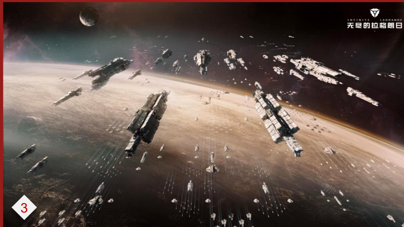
3. 无尽的拉格朗日：硬核太空科幻策略