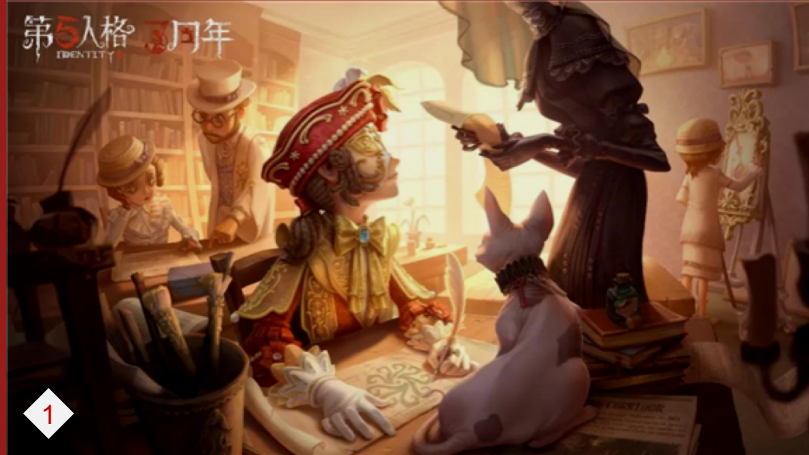
1. 第五人格：国内首款非对称竞技